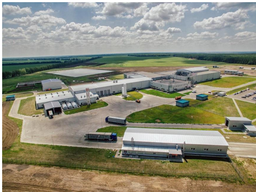
Тамбовский бекон 200x120x4 ст3 100x100x4 ст3